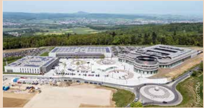
Viaoptic (links) residiert seit 2009 im Leitz-Park, einem architektonisch beeindruckenden Gewerbelände, das von der Unternehmenszentrale der Leica Camera AG dominiert wird.

Das Produkt- und Branchenspektrum ist breit gefächert. Zu jeweils rund 30 % Umsatzanteil gehen die kundenspezifischen Optiken und Präzisionsteile in die Automobilindustrie, die Sensorik und die Medizintechnik. In den restlichen 10 % fasst Viaoptic die Aktivitäten für die Beleuchtungsindustrie oder auch nichttransparente bzw. nichtoptische „Schwarzteile“ in Form von Gehäuse- und Fassungen u.a. für Leica zusammen. „Das größte Wachstumsthema ist das autonome Fahren und in diesem Zusammenhang Fahrerassistenzsysteme sowie Lidar, also Light detection and ranging, zur Abstands- und Geschwindigkeitsmessung von Objekten mittels IR-Laser. Ein neues Produkt, das weit überproportional wächst. Ebenso die Optik für Head-up Displays, eines unserer Hauptprodukte im Automobil, das sich stark überproportional entwickelt“, berichtet der Geschäftsführer. Ziel ist es, den Automobilbereich nicht größer als 40 % vom Gesamtumsatz werden zu lassen und die gute Branchenmischung beizubehalten, um robust gegen Schwankungen zu sein und die Abhängigkeit von einzelnen Kunden zu minimieren. Dabei liege die Herausforderung darin, die anderen Segmente mit dem Wachstumsmotor Automobil gleichziehen zu lassen.