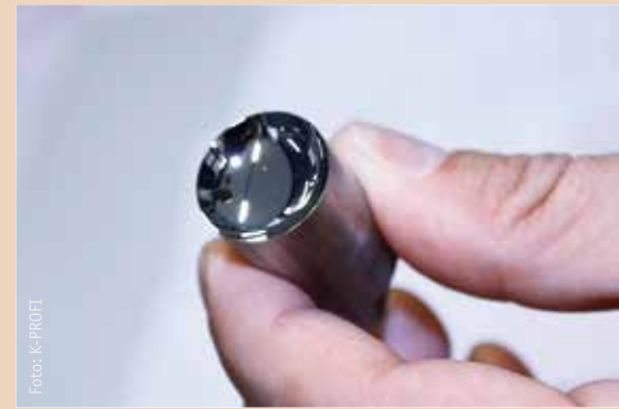
Für die Diamantbearbeitung werden die aus Stahl gefertigten Werkzeugeinsätze mit einer Nickel-Phosphor-Schicht versehen.

Obwohl Viaoptic mit seiner Gründung im Jahr 2003 noch als junges Unternehmen gilt, kann es auf über 50 Jahre Erfahrung mit op-