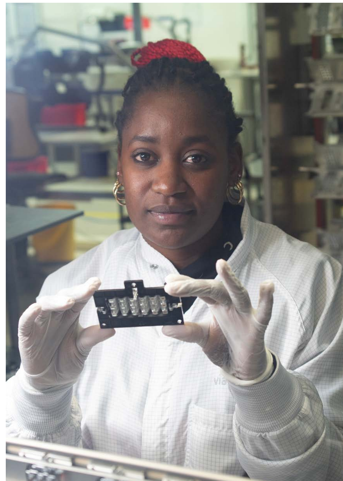
← Um anspruchsvollste Baugruppen und Kunststofflinsen fertigen zu können, braucht es Expertise. The manufacture of highly sophisticated assemblies and polymer lenses requires expert knowledge.